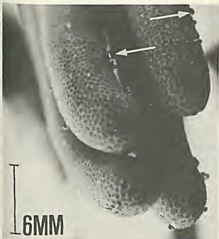
Figura 2 Gotículas de néctar.